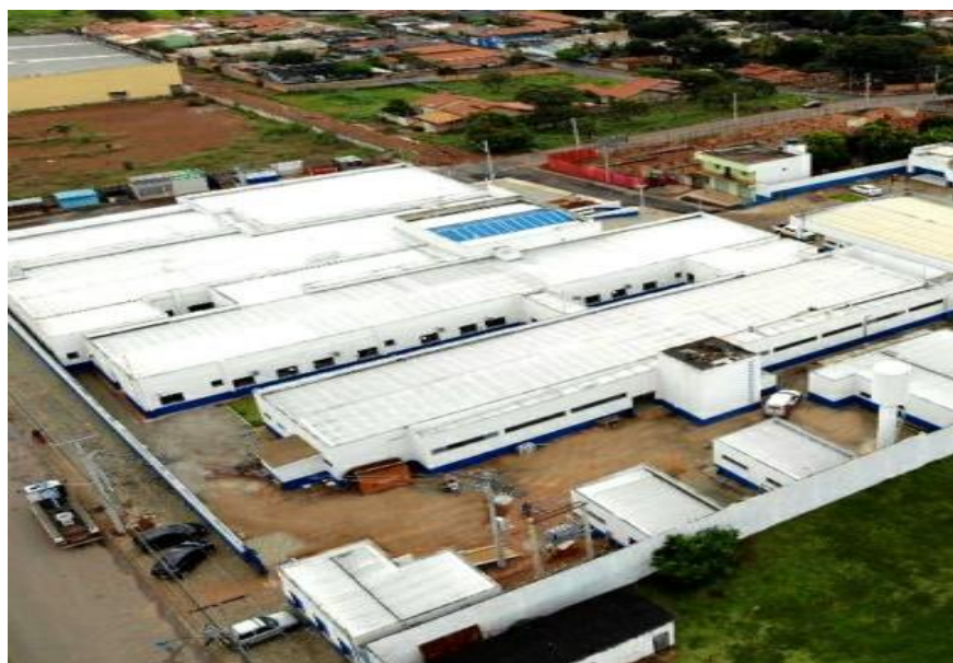
Figura 1. Imagem aérea

A Figura 1 apresenta a macrolocalização desta edificação: