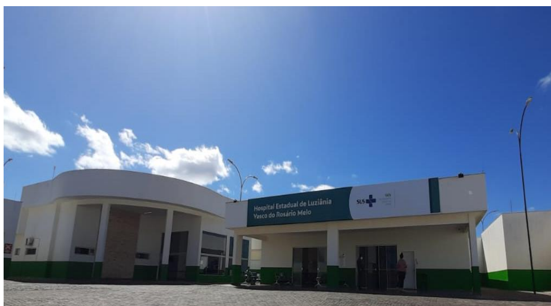
Figura 2. Fachada frontal atual

A seguir, na Figura 2 apresenta-se a fachada atual da edificação: